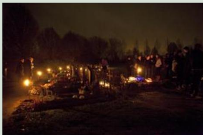
De begraafplaats aan de Van der Maelstedeweg in Hulst was gisteravond sfeervol verlicht met fakkels en de vele kaarsjes die mensen brandden bij het graf van een dierbare.