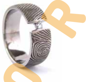
De vingerafdruk van uw dierbare voor altijd bij u