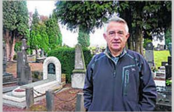
André September van KWB Dendermonde Centrum. Die vereniging wiedt onkruid op het kerkhof aan de Kerkhofweg.

De verenigingen van Dendermonde verdienden vroeger een stevige duit door oud papier op te halen. Nu staat de afvalintercommunale Verko daar zelf voor in. Een dikke streep door de rekeningen van ondermeer KWB, KSJ, scouts en noem maar op. Er werd een oplossing voor gevonden. De verenigingen mogen voortaan op de tien begraafplaatsen van Groot Dendermonde onkruid wieden en worden daarvoor vergoed. Zo wordt het verlies van de papierophaling gecompenseerd. Dat ging een tijdje goed, maar het bleef niet duren. Niet elke vereniging voert de taak even nauwgezet uit.